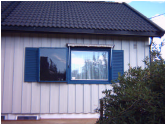
SOLTAN-1VFL placerat till vänster som "blindfönster" på villa i Norge