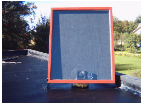
SOLTAN-1VFL på garagetak som värmer och torkar bilen i garaget.