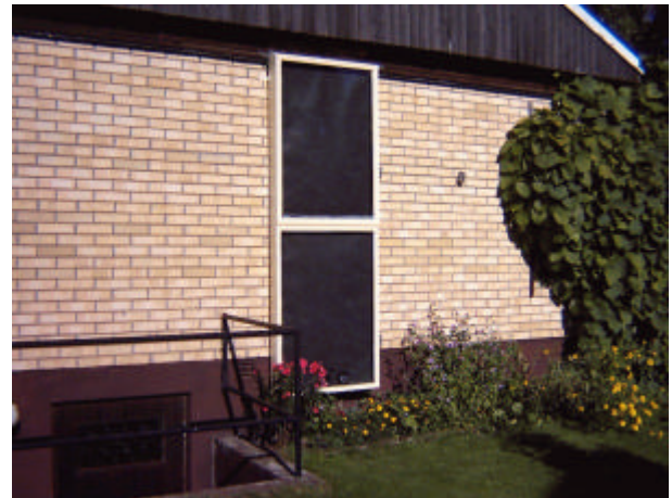
SOLTAN-1VFL på södergavel som blåser in frisk, varm luft till gillestuga i källaren.