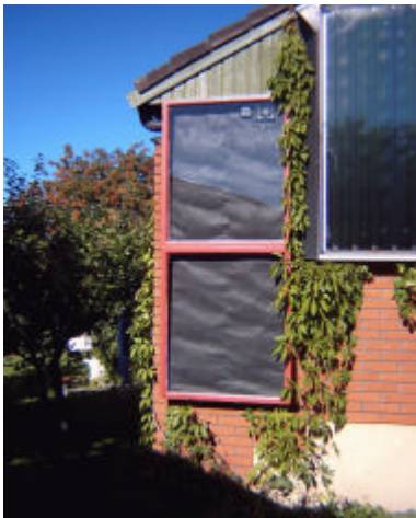
SOLTAN-1VFL på södergavel som blåser in varm luft till vävstugan i källaren. Till höger skymtar LESOL på 12 m 2 Den har värmt vatten i över 20 år.