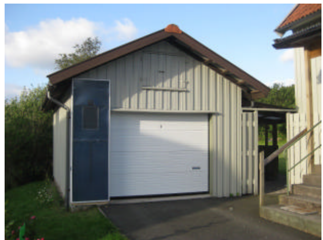
Solfångaren SOLTAN-1VFL värmer och ventilerar garaget. Den drivs med en inbyggd solcellspanel.