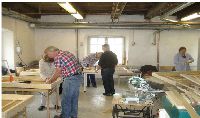
Bild från byggkurs på Folkhögskolan i Gysinge. Det är alltid damer med och bygger! Ofta är dom mycket miljö-medvetna och de har villa och stugor, men tror sig inte kunna bygga ensamma. Men dom är mycket duktiga att bygga på egen hand bara dom får lite informationshjälp!

Här är en solfångare med 2 st kopplade fönster.